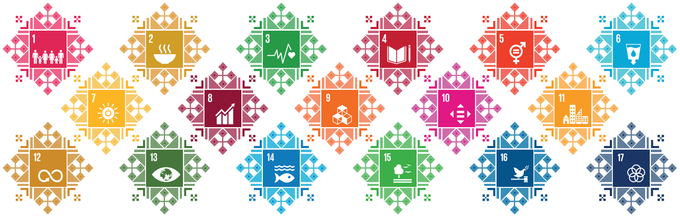
Рисунок 1. Семнадцать целей устойчивого развития

В нашей стране в 2016 году был принят Национальный план по правам человека Республики Беларусь 3 . Он призван содействовать осуществлению страной задач международной повестки дня в области развития до 2030 года, включая достижение 17 Целей устойчивого развития (ЦУР).