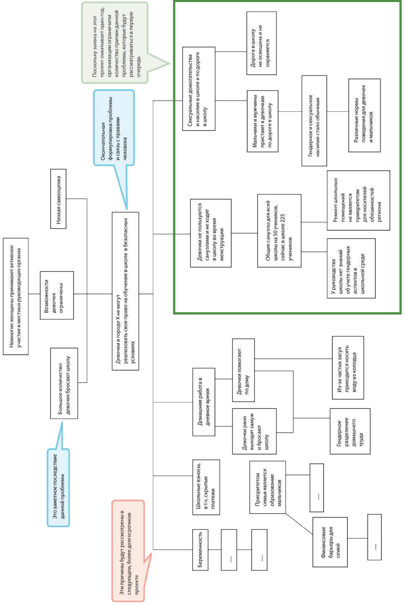
Рисунок 2. Дерево проблем (Город и акторы вымышлены)